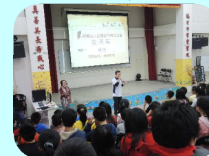
紅絲帶基金會愛現幫宣導愛滋病防治