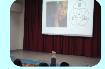
想想看：為什麼會牙痛