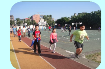
每天固定跑操場消耗熱能鍛鍊體力