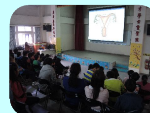
瞭解女生生理構造及生理期成因