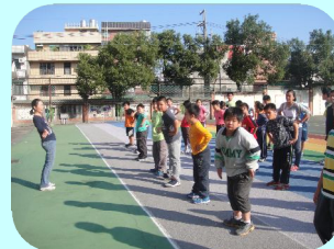
體育組長期操練體位過重學生