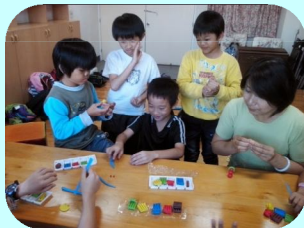
小團體輔導紙黏土上課