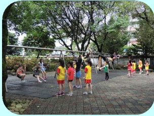
每節下課到戶外活動放鬆眼肌