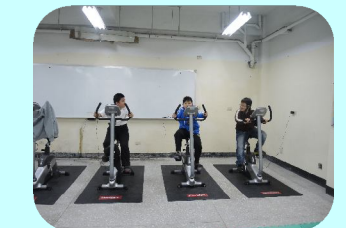
兩天則在樂活教室踩腳踏車