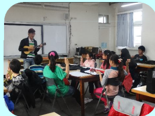
弱勢學童彩虹學堂—教授烏克麗麗