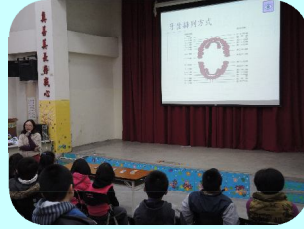
護理師介紹牙齒排列方式