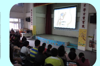
認識男性生殖器官及如何保護自己