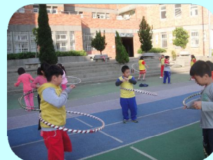
搖呼拉圈消耗熱能減少腹部肌肉