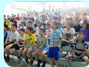
五年級全體師生認真參與上課