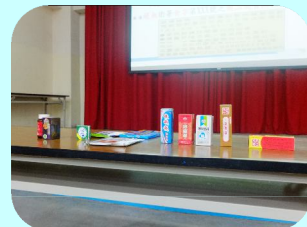
藥師自備各式常見成藥呼籲少用