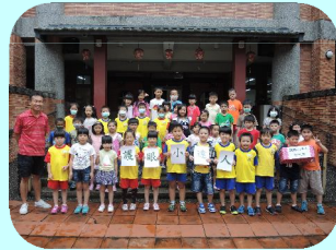
低年級各班護眼小達人開心合影