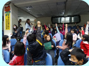
台灣寶貝狗協會進行生命教育宣導