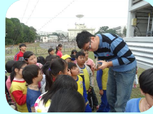
弱勢生中央大學校外參觀教學