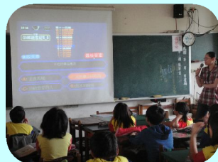
百蒿小學堂正確用藥知識問答