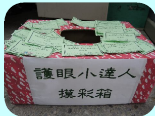
護眼小達人摸彩活動鼓勵天天護眼