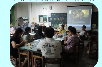
親師座談向家長介紹愛滋病