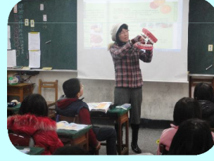
老師課堂示範貝氏刷牙法